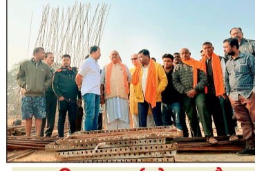
35 प्रतिशत कार्य हो चुका है